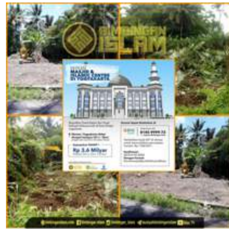
Pembersihan Lahan Islamic Center

Tim Satgas penanganan Covid-19 kantor Yayasan Bimbingan Islam telah melaksanakan salah satu prosedur protokol kesehatan, yaitu Penyemprotan Des-infektan rutin, yang dilaksnakan pada 20 November 2020. Penyemprotan bertujuan untuk pencegahan dari wabah covid-19. Selain itu, tim satgas Covid jujan melaksanakan berbagai prosedur protokol kesehatan di kantor Yayasan Bimbingan Islam Yogyakarta terkait dengan usaha pencegahan dari wabah Covid-19.