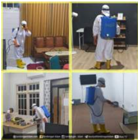
Penyemprotan Rutin Disinfektan

Tim Satgas penanganan Covid-19 kantor Yayasan Bimbingan Islam telah melaksanakan salah satu prosedur protokol kesehatan, yaitu Penyemprotan Des-infektan rutin, yang dilaksnakan pada 20 November 2020. Penyemprotan bertujuan untuk pencegahan dari wabah covid-19. Selain itu, tim satgas Covid jujan melaksanakan berbagai prosedur protokol kesehatan di kantor Yayasan Bimbingan Islam Yogyakarta terkait dengan usaha pencegahan dari wabah Covid-19.